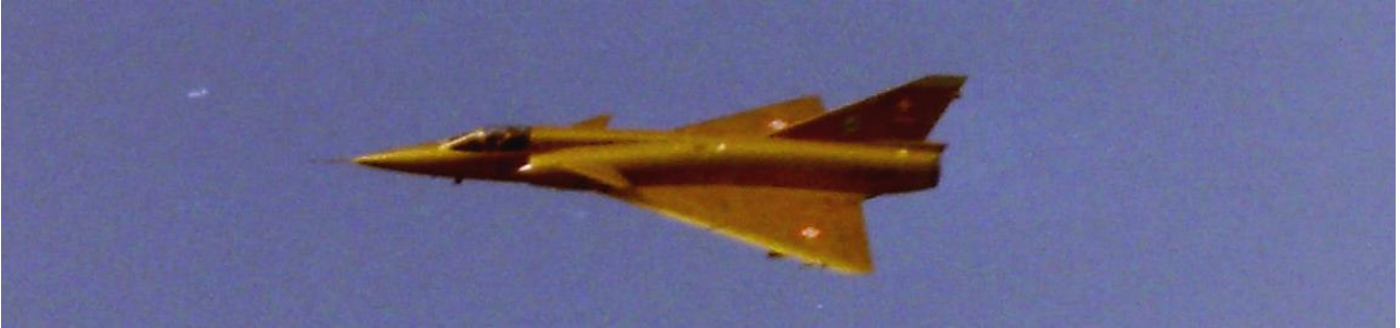
Un mirage en or, mirage ou réalité ?

La cérémonie d'adieu au mirage III s'est déroulée le 22 octobre 1999 à Buochs, près de Stans. Les prévisions météo des jours précédents étant plutôt pessimistes, c'est armés d'imperméables et de films sensibles qu'une quinzaine de membres de l'AVIA-DCA se sont embarqués pour la manifestation.