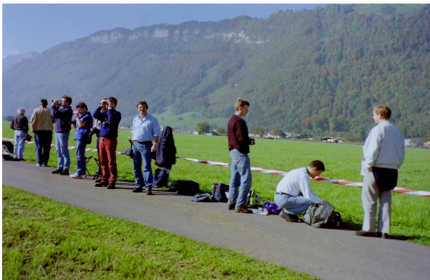
Les spectateurs postés à quelques mètres du tarmac.

Une journée radieuse « digne d'un ciel Valaisan ! » dicit Mario G, nous a permis de faire de superbes photos. La disposition du statique et l'accessibilité des avions nous ont offert une moisson de souvenirs qui resteront dans les annales.